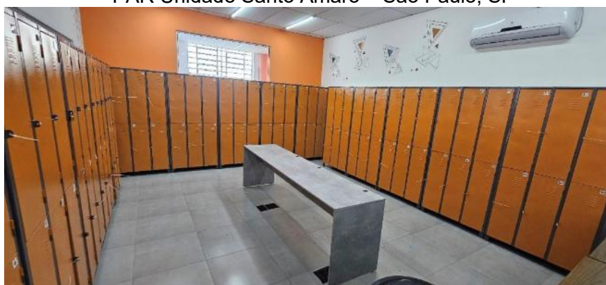
Figura 2: Espaço de guarda de bens e pertences. PAR Unidade Santo Amaro – São Paulo, SP

O Serviço de Guarda de Bens e Pertences tem por finalidade possibilitar que as pessoas atendidas pelo Programa Cidadania PopRua armazenem, de forma segura e organizada, seus objetos pessoais durante o período de utilização do equipamento ou dos serviços ofertados. Para o funcionamento do serviço, o equipamento deverá dispor de infraestrutura adequada para a proteção e organização dos pertences , incluindo espaço físico apropriado, compartimentos individualizados para guarda de objetos pessoais de pequeno e médio porte e sistema de registro dos termos de guarda de pertences, mantidos em arquivo digital obrigatório e, quando aplicável, em arquivo físico.